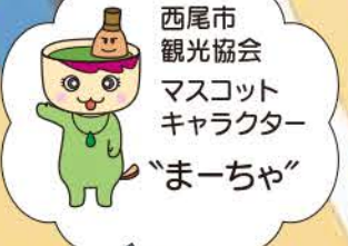
西尾市観光協会 マスコットキャラクター "まーちゃ"