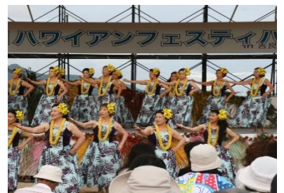
ハワイアンフェスティバル