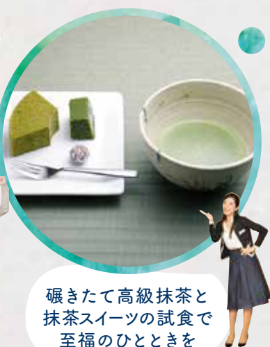
碾きたて高級抹茶と抹茶スイーツの試食で至福のひとときを

本施設は予約制です。インターネットまたはお電話でご予約ください。※予約可能日時は下記ホームページでご確認ください。