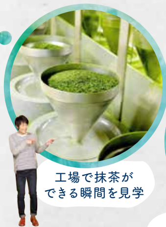
工場で抹茶ができる瞬間を見学