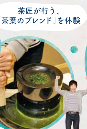
茶匠が行う、「茶葉のブレンド」を体験