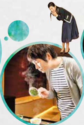
茶匠が行う、「茶葉の品質鑑定」を体験